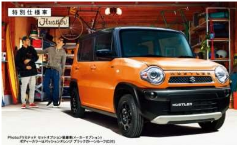
Photo:フリミテッド セットオプション装着車(メーカーオプション) ボディカラーはパッションオレンジ ブラック2トーン(ルーフ付) (02)