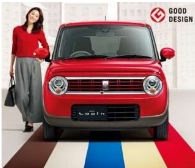
Photo Fリミテッド デュアルカメラブレーキサポート・全方位モニター付メモリーナビゲーション 装着車 / ボディーカラーはベリメスゴールドパールメタリック ブラックスターンルーフ(BFL)

* メーカーオプションはご注文時に申し受けます。ご注文後はお受けできませんのでご了承ください。